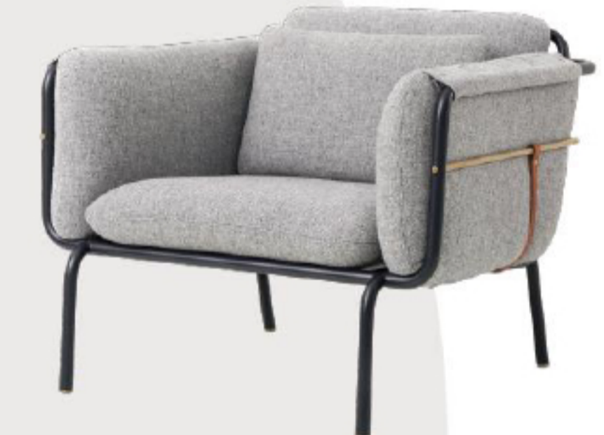
STELLAR WORKS VALET布艺俱乐部沙发椅

灰色的家居单品极具百搭，也有着无比的包容性。对于新手来说，可以毫无难度地挑选自己喜爱的灰色家具，融入任何居室环境都不必担心出错。对于设计高手，灰色又能给你极大的发挥空间，呈现极致高级感。