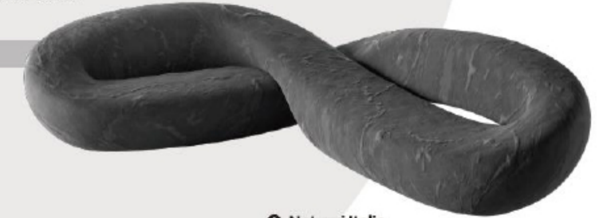
Natuzzi Italia The Circle of Harmony系列Infinito沙发 (from克拉斯家居)

沙发椅柔软舒适，粉末涂层钢框架线条简洁而坚固，平衡了柔软靠背及坐垫的“躺椅”感，是经久耐看的家居单品。