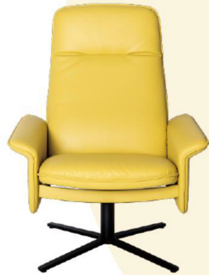
De Sede DS 55皮质扶手沙发

造型如一朵盛开的郁金香般灵动秀美、亭亭玉立，加之巧妙细腻的工艺，呈现出围合感的柔软坐席。背靠和扶手的细节极具生态感，由厚而薄直至纤细的花瓣，给人优雅舒适的体验。