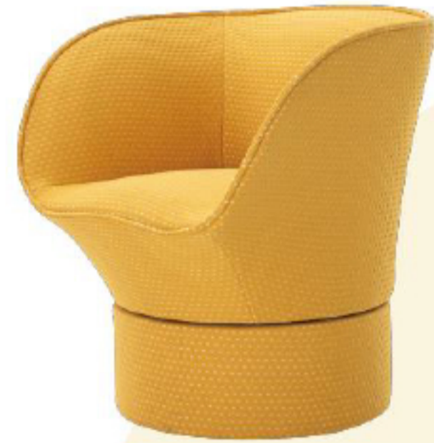
都汇里CALA朵朵单人椅

造型如一朵盛开的郁金香般灵动秀美、亭亭玉立，加之巧妙细腻的工艺，呈现出围合感的柔软坐席。背靠和扶手的细节极具生态感，由厚而薄直至纤细的花瓣，给人优雅舒适的体验。