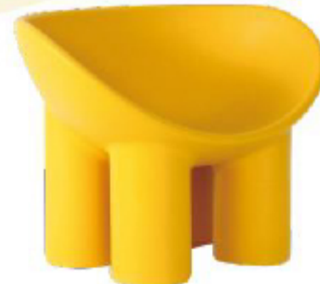
Driade Roly Poly系列休闲椅

充满禅意工业风的柜体系列，利用工业技术实现手工工匠制造外观，高品质烤漆工艺，让柜体表面呈现出流动的光泽感。从现代设计与极简主义中汲取灵感，用现代设计语言书写出的柜体史诗，简洁中蕴含力量，平凡间层次分明。