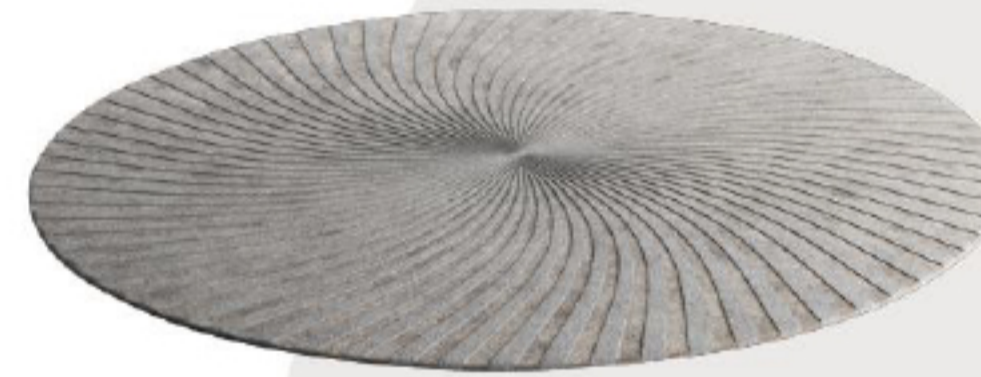
Natuzzi Italia Deep系列Vortex地毯 (from克拉斯家居)

来自小礼裙设计灵感，高级感的莫兰迪灰色系，搭配荷叶边领口，让水泥花盆也焕发细腻风姿。收口式造型方便固定花型，花材随意搭配就很美。